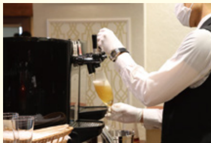
瓶ビールの提供をやめ、生ビールをお楽しみいただけます。