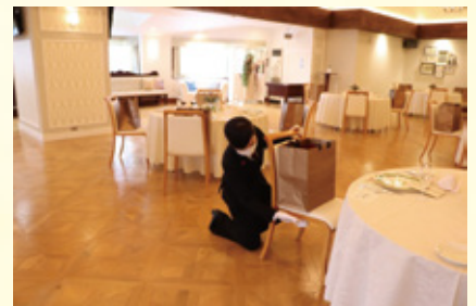
テーブル、いす等のご宴席開始前に清拭消毒を行います。