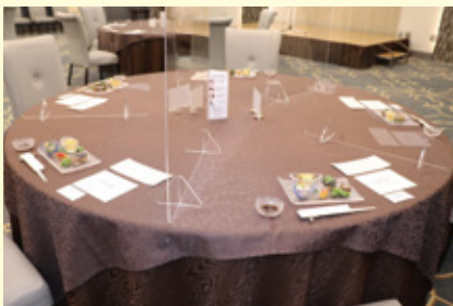
テーブル間の間隔を最低2m以上空けてセッティング、アクリルパーテーションを設置いたします。

体調がすぐれない場合や発熱がある場合は、ご来館をご遠慮いただきますようお願い致します。